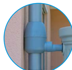
FIL PLUS G